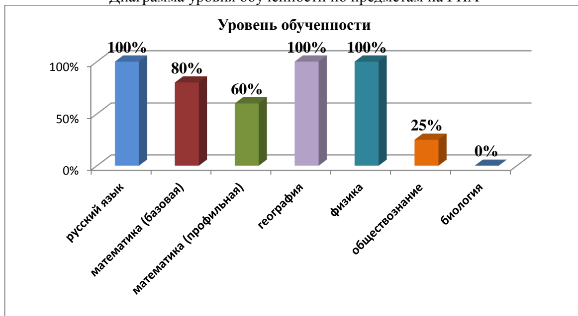
Диаграмма уровня обученности по предметам на ГИА

Не все учащиеся подтвердили свои знания по выбранным предметам: